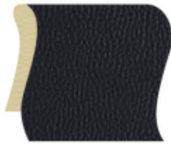
Schwarz (elektrisch leitfähig)

Medistat Pflegeempfehlung | Medistat Desinfektionsmittelempfehlung | Medistat Technische Daten