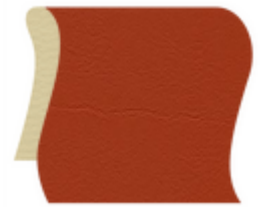
Rost, Karneol (F6461557)