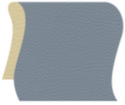
Stone Blue (F6471001)